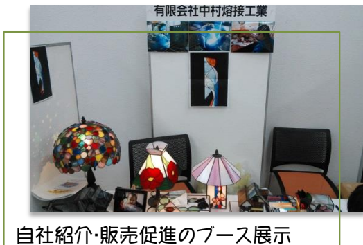
自社紹介・販売促進のブース展示