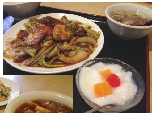
↑ 回鍋肉と手作り杏仁豆腐

中華料理を自分で美味しく作るのなかなか難しいかと思いません。本場の中華を味わいに、是非、裕福来さんへお立ち寄りください！