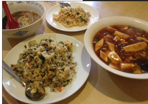
← 麻婆麺に半炒飯と、高菜炒飯に半ラーメン

中華料理を自分で美味しく作るのなかなか難しいかと思いません。本場の中華を味わいに、是非、裕福来さんへお立ち寄りください！