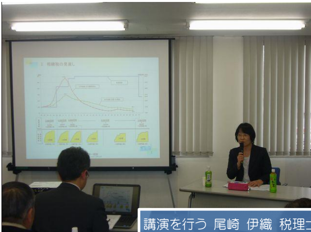
講演を行う 尾崎 伊織 税理士