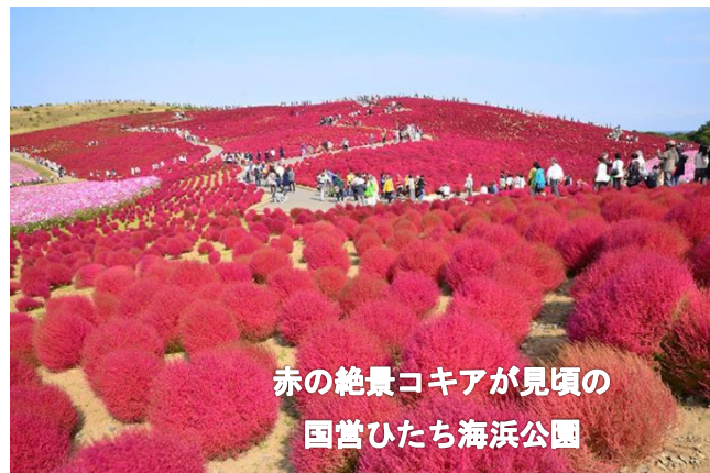
赤の絶景コキアが見頃の 国営ひたち海浜公園